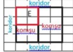
Örnek Çizim - Bitişik Stantlar